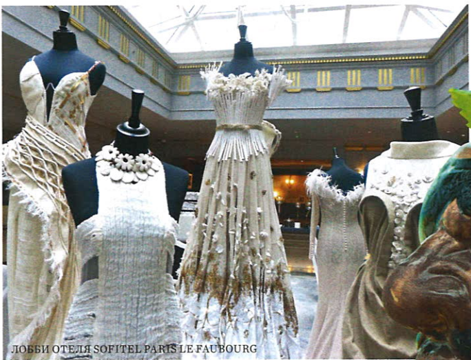
ЛОББИ ОТЕЛЯ SOFTEL PARIS LE FAUBOURG

Softel Paris Le Faubourg претендует на звание одного из самых модных отелей Парижа: съют Couture Apartment здесь украшают фотографии моделей Жан-Поля Готье, коридоры – снимки Хорста П. Хорста и Ирвина Пенна, а в лобби проходит выставка кутюрных платьев, организованная в сотрудничестве с La Fédération Française de la Création Couture Sur Mesure .